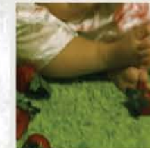
SANGRE de Cris Ventura