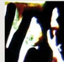
NUVEM de Avrore